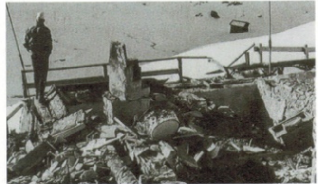
Nach dem Brand 1971