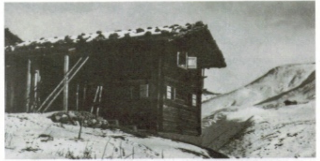
Alte Spörryhütte um 1930