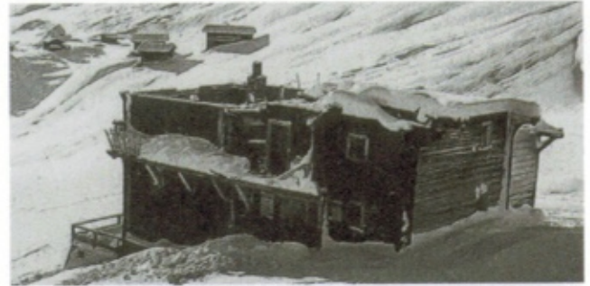
Nach dem Föhnsturm 1954